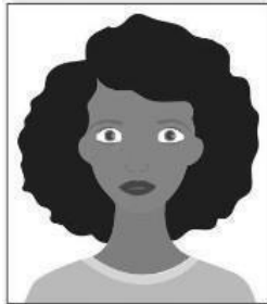
Figura 1. Modelo de Foto Frontal